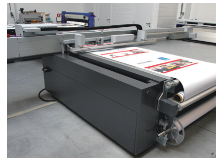
Printville's Impala, de eerste in België, met alles erop en eraan.